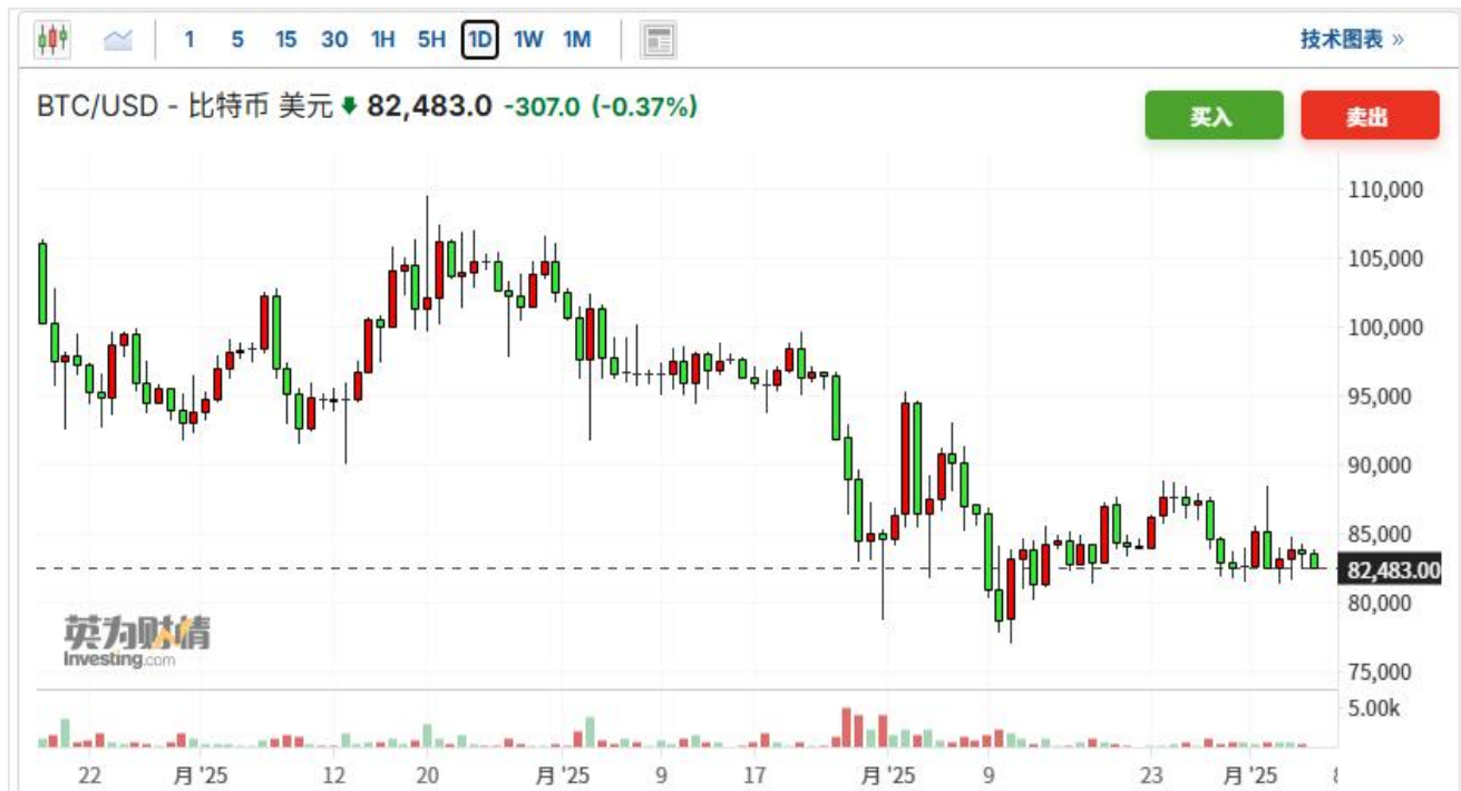
圖一：比特幣價格情況

過去一段時間來，特朗普關稅戰引發的混亂與憂慮，疊加美國通脹預期的反彈，加劇了市場對美國經濟可能陷入“滯漲”甚至“衰退”的擔憂。這種擔憂對高風險資產構成重大利空，衝擊了連漲兩年且處於高位的美股估值，並傳導至加密貨幣市場。在加密市場方面，比特幣價格從 1 月初 10.2 萬美元的價格持續回調，累計回調幅度達到 18%；以太坊價格從 1 月初 3300 美元回調至 1800 美元，回調幅度達到 45%。