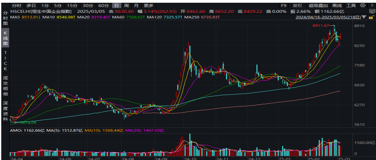
恒生中国企业指数日行情 (2024 04 16 - 2025 03 05)