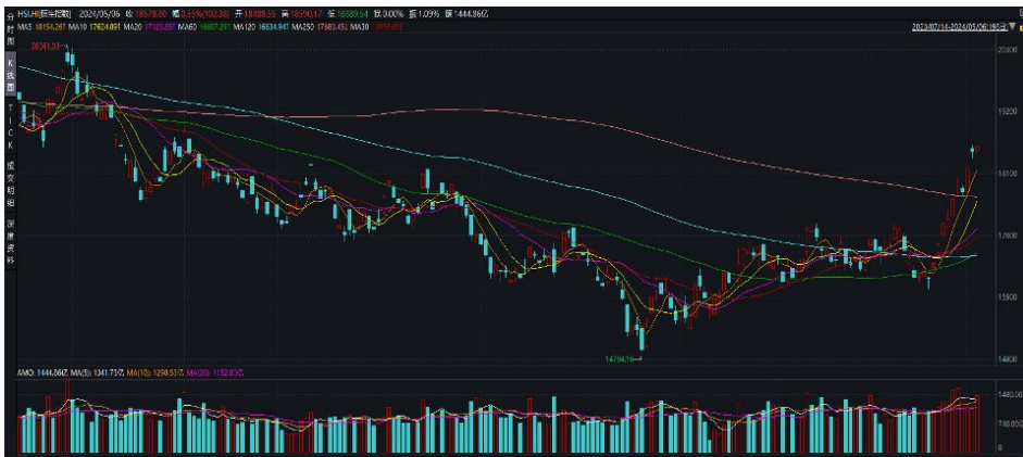
恒生指数日行情 (2023 07 14 - 2024 05 06)

相对于上一个月，2024年4月恒生指数涨7.39%报17763.03点，恒生金融指数涨9.65%报30648.90点，恒生公用事业指数涨1.46%报33798.99点，恒生地产指数涨5.67%报16400.85点，恒生工商业指数涨6.65%报9842.07点，恒生中国企业指数涨7.97%报6273.75点，恒生科技指数涨6.42%报3700.67点。