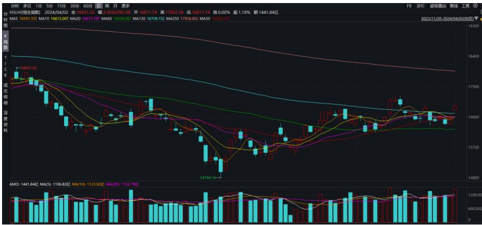
恒生指数日行情 (2023 11 20 - 2024 04 02)

相对于上一个月，2024年3月恒生指数涨0.18%报16541.42点，恒生金融指数跌4.48%报27952.34点，恒生公用事业指数跌2.61%报33313.6点，恒生地产指数跌5.16%报15521.06点，恒生工商业指数涨3.61%报9228.2点，恒生中国企业指数涨2.34%报5810.79点，恒生科技指数涨1.35%报3477.55点。