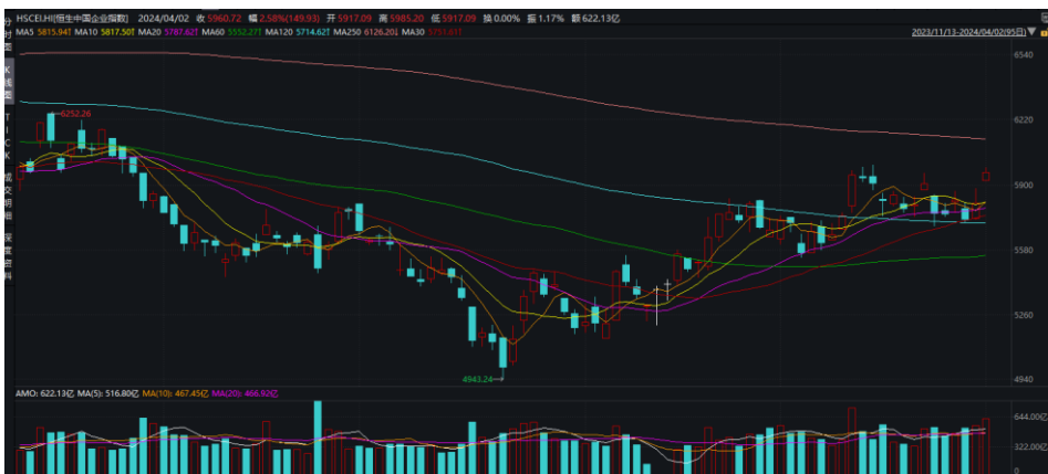
恒生中国企业指数日行情 (2023 11 13 - 2024 04 02)