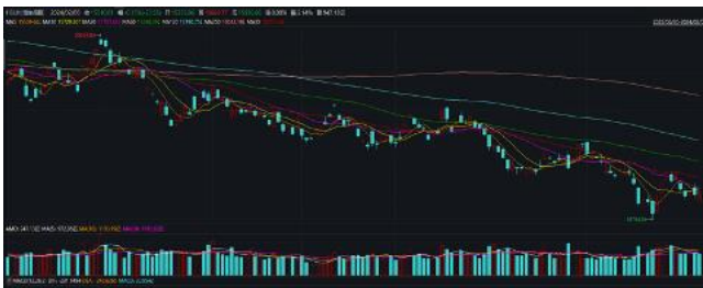
恆生指數日行情 (2023/06/30-2024/02/05)

相對於上一個月，2024年1月恆生指數跌9.16%報15485.07點，恆生金融指數跌5.15%報28286.29點，恆生公用事業指數跌1.68%報32320.06點，恆生地產指數跌14.61%報15650.02點，恆生工商業指數跌11.40%報8180.94點，恆生中國企業指數跌9.96%報5194.04點，恆生科技指數跌20.15%報3005.8點。