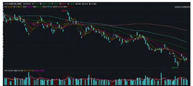
恆生中國企業指數日行情 (2023/04/21-2024/02/05)