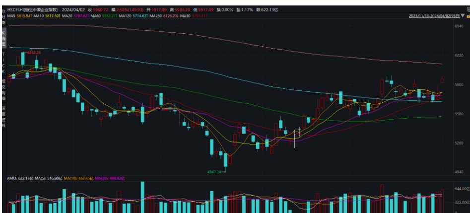
恆生中國企業指數日行情 (2023 11 13 - 2024 04 02)