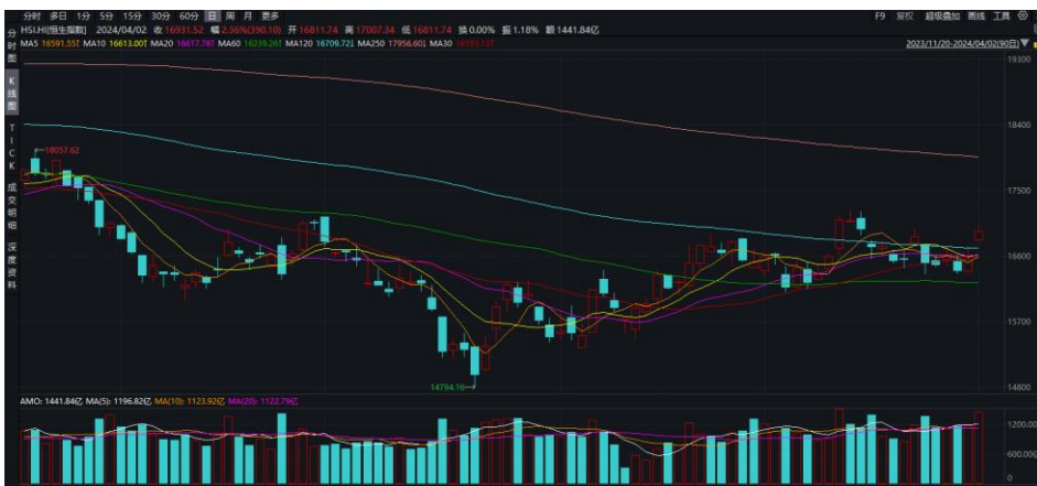
恆生指數日行情 (2023 11 20 - 2024 04 02)

相對於上一個月，2024年3月恆生指數漲0.18%報16541.42點，恆生金融指數跌4.48%報27952.34點，恆生公用事業指數跌2.61%報33313.6點，恆生地產指數跌5.16%報15521.06點，恆生工商業指數漲3.61%報9228.2點，恆生中國企業指數漲2.34%報5810.79點，恆生科技指數漲1.35%報3477.55點。