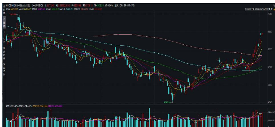
恆生中國企業指數日行情 (2023 07 18 - 2024 05 06) (Source: Win.d)