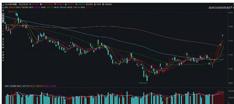
恆生指數日行情 (2023 07 14 - 2024 05 06)

相對於上一個月，2024年4月恆生指數漲7.39%報17763.03點，恆生金融指數漲9.65%報30648.90點，恆生公用事業指數漲1.46%報33798.99點，恆生地產指數漲5.67%報16400.85點，恆生工商業指數漲6.65%報9842.07點，恆生中國企業指數漲7.97%報6273.75點，恆生科技指數漲6.42%報3700.67點。